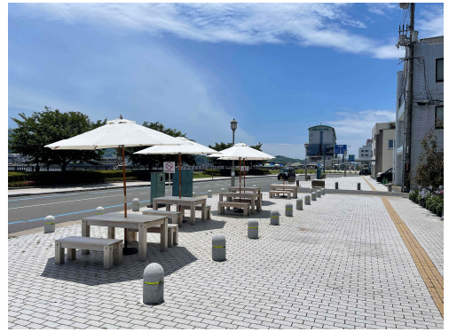
(市道尾道駅前尾崎線)