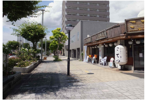
(市道常盤通り宇部新川駅線)