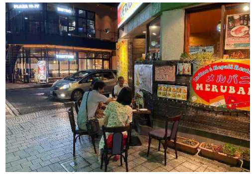
(市道宇部新川恩田線)