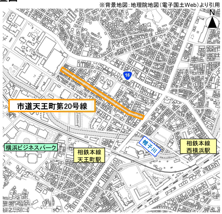
橙囲：歩行者利便増進道路