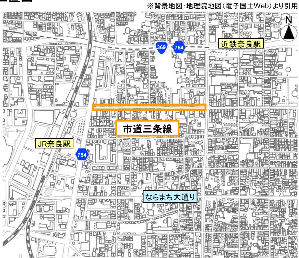
オレンジ：歩行者利便増進道路