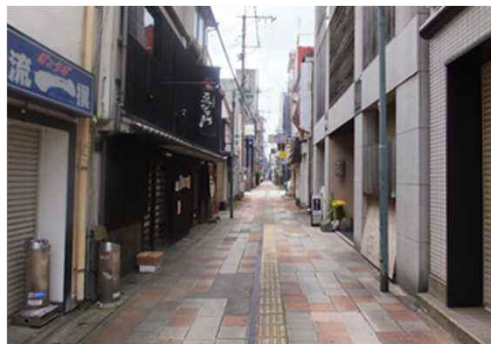
(市道豊前田町2号線)